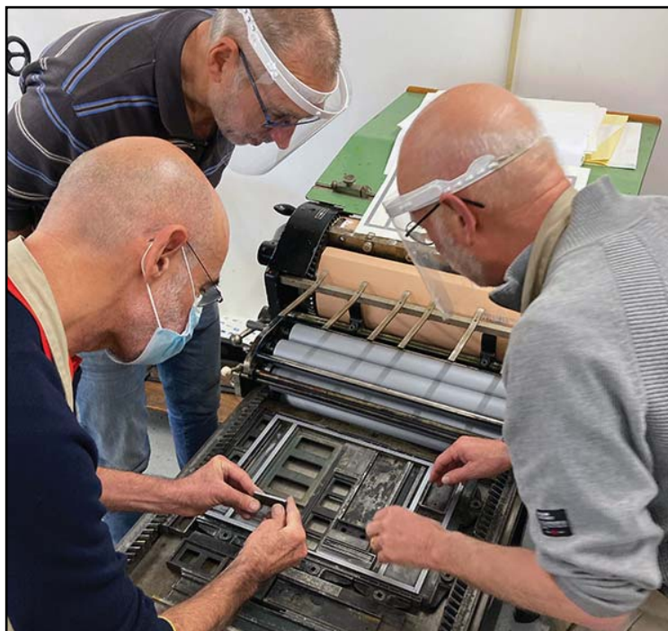
De drukvorm wordt zeer nauwkeurig op stand gezet op de drukpers.