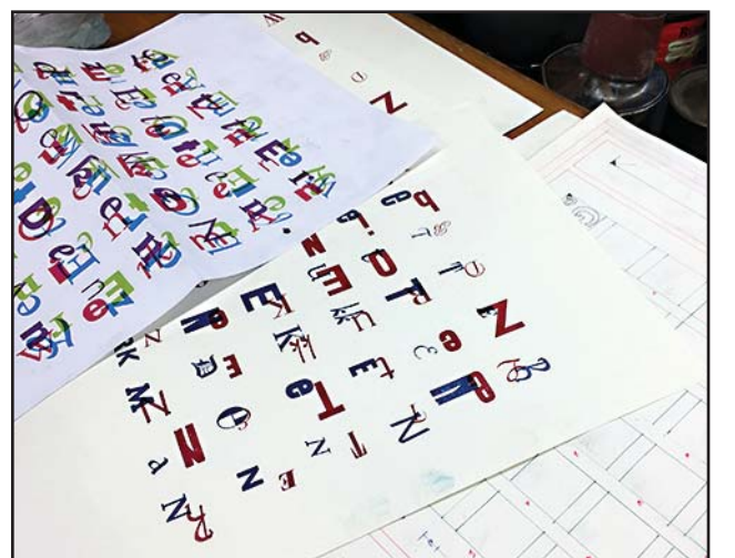
Enkele proefdrukken zijn er nodig om tot goede afdrucken te komen. Rechts op de foto de technische layout.