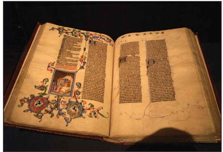
De Gutenberg Bijbel is te zien in het Plantijn Moretus Museum te Antwerpen.

Het jaartal 1501 als grens is arbitrair. Het geeft niet direct een omslagpunt in de boekdrukkunst aan, maar is alleen het eerste jaar van de 16e eeuw. Wel maakt de 'incunabelstijl' in de eerste twintig jaar van de zestiende eeuw duidelijk plaats voor de moderne renaissancistische typografie, die begon met de Venetiaanse drukker Aldus Manutius (actief van 1495-1515). Het jaartal 1500 wordt sinds de 17e eeuw algemeen gebruikt als symbolisch