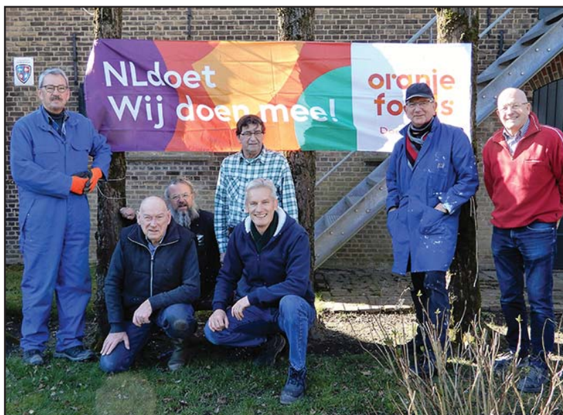
De vrijwilligersploeg, die de klussen kwam klaren in het Nederlands Drukkerij Museum.