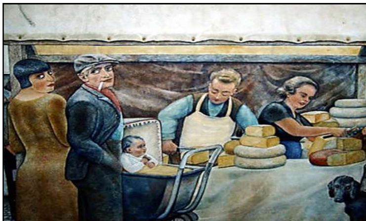
Het Kaasstalletje, één van de werken van Jan Strube.