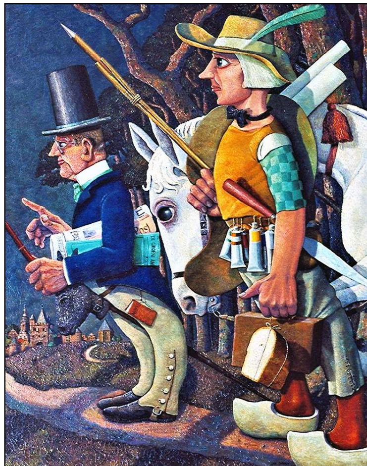
Don Quichotte en Sancho Panza, een van de vele werkstukken