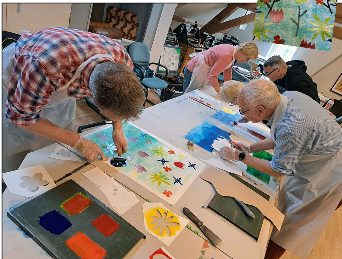
De sjabloontjes zijn gemaakt en de deelnemers zijn aan de slag gegaan.

Recentelijk hadden we weer het genoegen om voor een aantal mensen een workshop Werkman te mogen verzorgen. Mensen, die Werkman wel kenden, maar niet wisten hoe hij werkte om zijn “druksels” te maken. Het eerste wat we horen is: “ik heb geen idee hoe en wat ik kan maken”. Om uiteindelijk aan het eind van de workshop te constateren dat ze het helemaal nog niet zo gek er van af brachten. Een foto-impressie van de workshop.