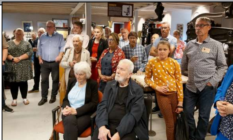
Er was veel belangstelling bij de opening van de tentoonstelling