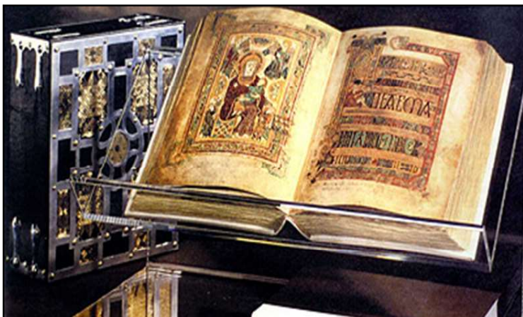
Binnenpagina's van het Book of Kells.

en Nobelprijswinnaar Samuel Beckett en kunstgeschiedenisboeken. De belangrijkste kamer van de Old Library is de magnifieke Long Room. Deze opvallende hal van 65 m. lang, met een prachtig half-cilindrisch gewelfd plafond, donkere eiken balken en marmeren busten, is een beeld dat je nog lang bij zal blijven.