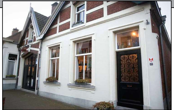
Museum en woonhuis in Wouw.

De aantallen bezoekers wisselden, maar elk jaar kreeg het museum toch wel enkele duizenden belangstellenden over de vloer, ook uit België en Frankrijk. Al sinds de opening in 1975 blijkt het museum het zonder financiële steun te roeien. Het