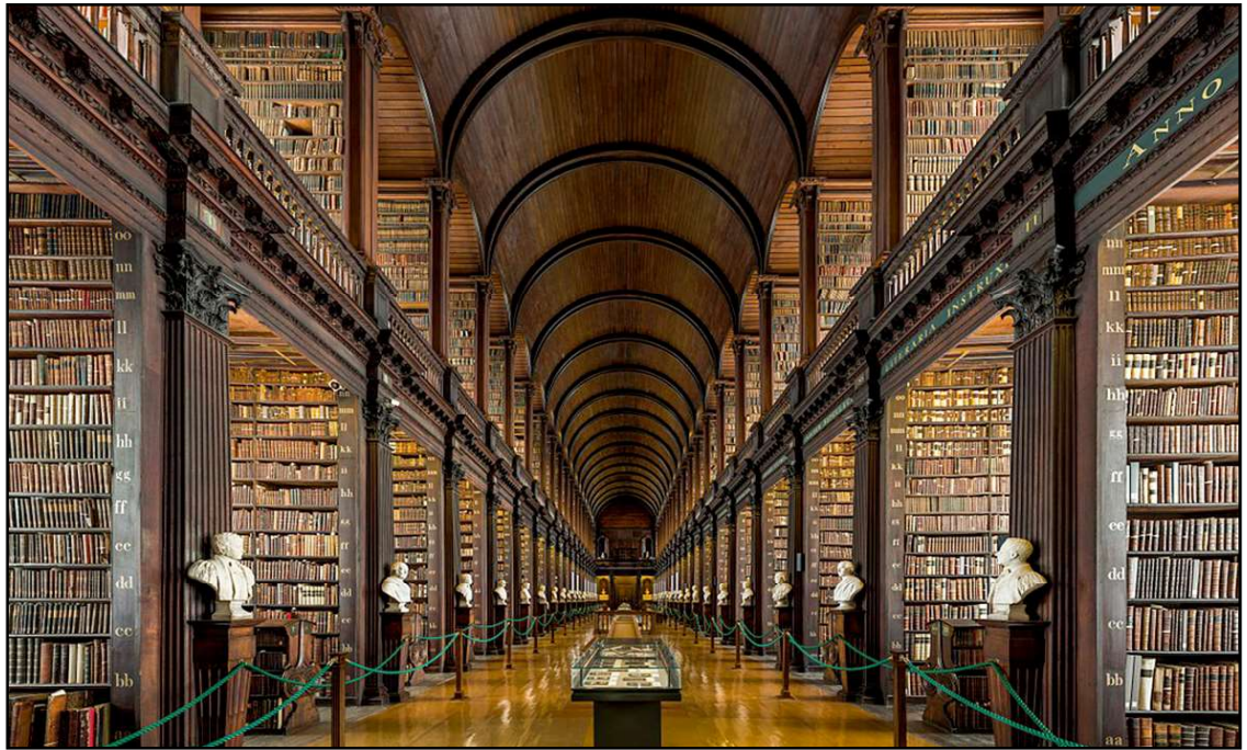
De lange kamer van het Trinity College Library in het centrum van Dublin.

LEGENDARISCH GESCHIEDENIS: Over de vroege geschiedenis van het boek lopen de meningen van wetenschappers wat uiteen, maar de meesten zijn het erover eens dat het boek waarschijnlijk zijn oorsprong heeft op het afgelegen Schotse eiland Iona. Het zou vervolgens zijn afgemaakt in