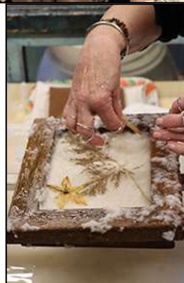
Er werden zeer creatieve werkstukjes gemaakt.

De vrijwilliger bij het Nederlands Drukkerij Museum ziet de toekomst van het museum dan ook rooskleurig tegemoet. "Daar zijn wij ook best wel trots op. Net als andere vrijwilligersorganisaties werken wij op basis van donaties en zijn wij afhankelijk van dagen zoals vandaag. Ieder jaar presteren wij het om in de zwarte cijfers te belanden, en zeker in deze tijd is dat heel mooi", sluit secretaris Jochems af.