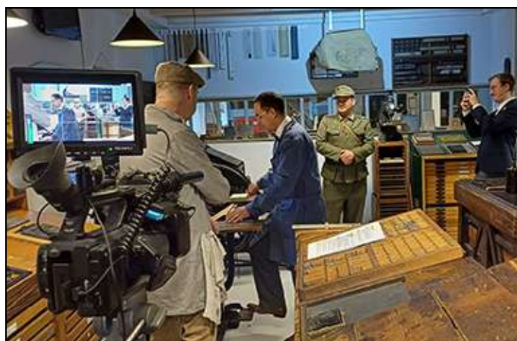
Een repetitie van de acteur om zich de bediening van trapdegel eigen te maken.

was in de drukkerij. Naast zijn verplichte werk drukte hij ook illegaal drukwerk. De Duitsers verboden vrije pers en niet alle nieuwsberichten mochten worden verspreid. Daarom verschenen er illegale kranten, die toch berichten van de geallieerden naar buiten brachten. Helaas is onbekend bij welke drukkerij hij in de periode 1940-1945 in Roosendaal werkzaam was. De première van de film is in mei.