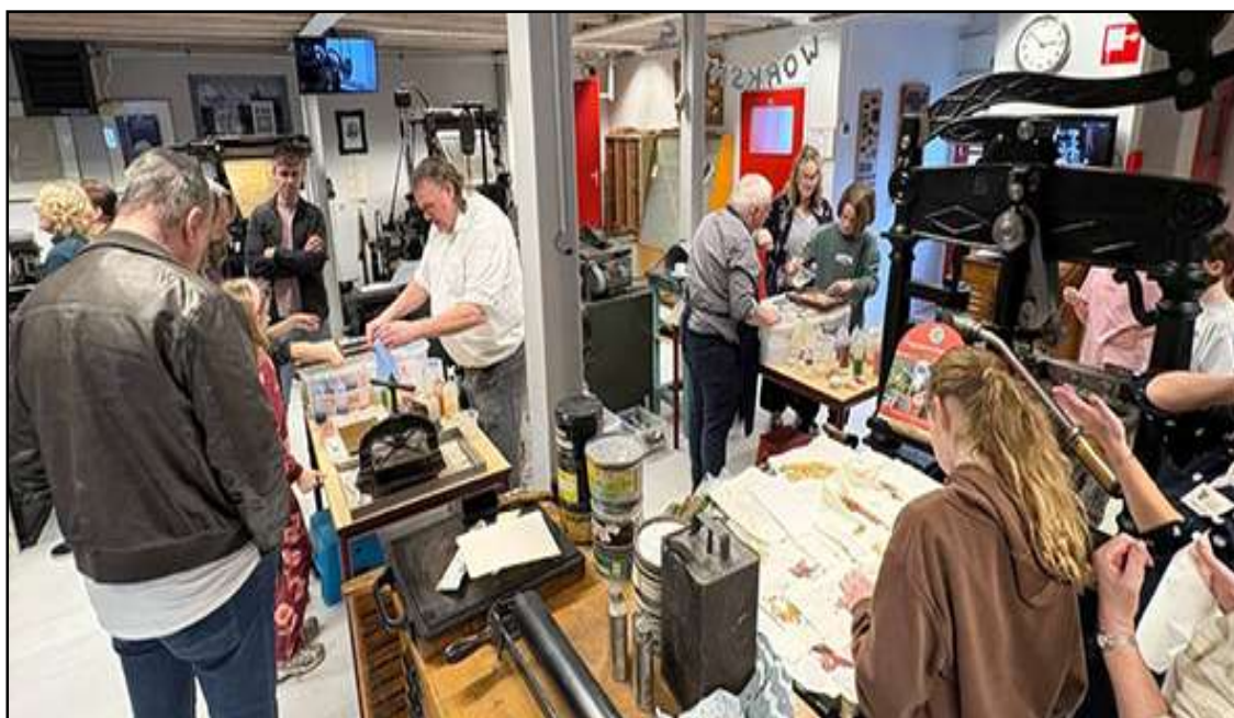
Veel bezoekers tijdens de workshop papierscheppen.

Het is ook een bijzonder ambacht dat door Ewald Weijers wordt uitgevoerd. Sinds 2013 staat papierscheppen op de lijst van immaterieel erfgoed, wat nog maar door een paar mensen in Nederland gedaan wordt. Daarbij